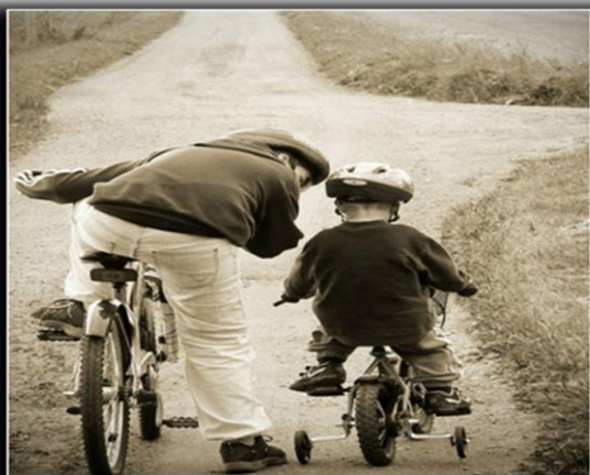
Wsparcie Coś co sprawia, że osiągnięcie celu wydaje się znacznie łatwiejsze.